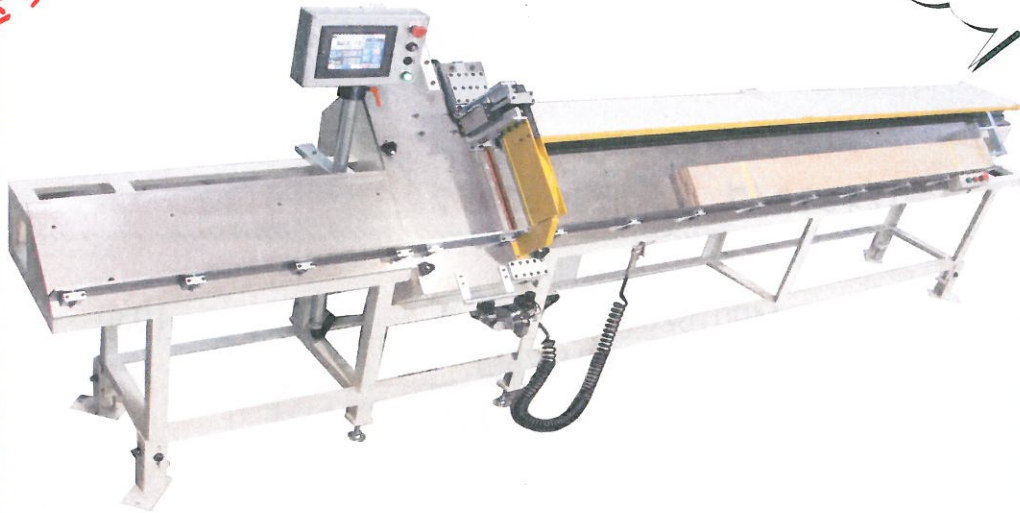
MODEL : HCR1-2400-1-D-NC-(M)